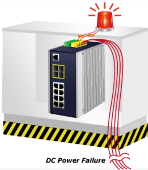
DC Power Failure