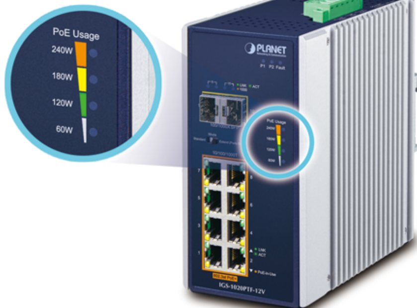
PoE Power Usage Display

ČSN EN 61000-4-11:2004 - Krátkodobé poklesy napětí, krátká přerušení a pomalé změny napětí