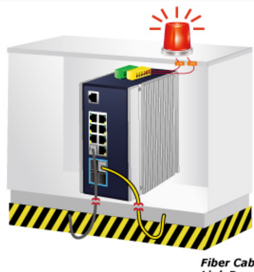
Fiber Cable Link Down